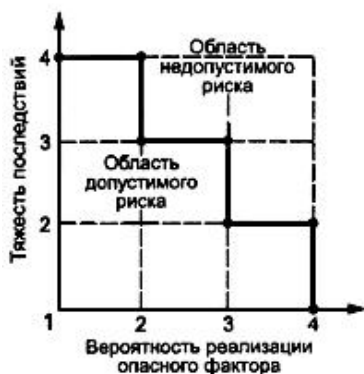
Рисунок Б.1 - Диаграмма анализа рисков